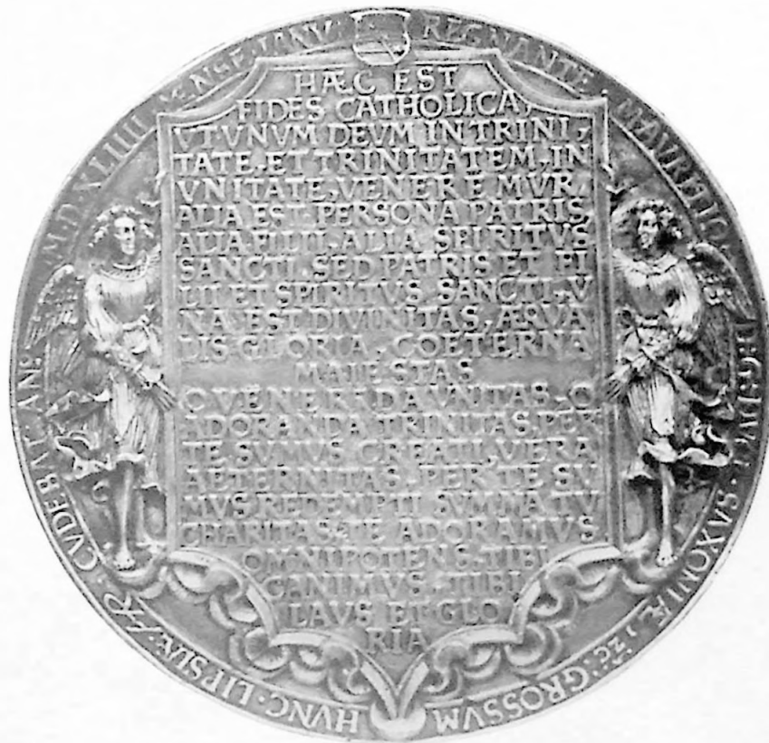
Dreifaltigkeitsmedaille 1544. Hans Reinhart.