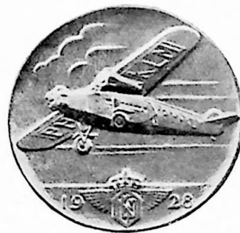
2e Penning van het Vereenigingsjaar 1928.