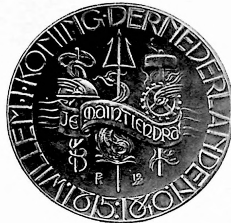
1e Penning van het Vereenigingsjaar 1928.